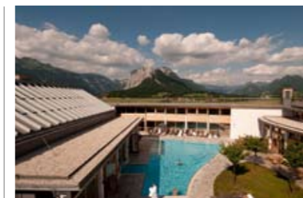
GANZJAHRESWELLNESS: Das beheizte Solebecken ist auch im Winter offen.

BAD AUSSEE IST NICHT NUR DER GEOGRAFISCHE MITTELPUNKT ÖSTERREICHS, sondern seit jeher Anziehungspunkt für Erholungssuchende. Bereits 1868 wurde Aussee zum Kurort erklärt, seit 1911 darf der Ort offiziell den Titel „Bad“ dem Namen voranstellen. Im 19. Jahrhundert waren es vor allem die blaublütigen Zeitgenossen, die dem Charme des steirischen Salzkammerguts verfielen. Allen voran Erzherzog Johann, dessen Geschichte im Ausseerland jedes Kind kennt. Der volksnahe Modernisierer, der die Steiermark in ein neues Zeitalter führte und für die Liebe zur bürgerlichen Postmeistertochter Anna Plochl auf den Thron verzichtete. Ihm kann man auch heute kaum entkommen. Erzherzog Johann lacht aus Schaufenstern, von Speise- und Ansichtskarten und von Hausfassaden. In Gasthäusern und Hotels sind Speisesäle, Stüberln und Zimmer nach dem Erzherzog benannt. Auch im Lindner Hotel & Spa – Die Wasnerin trägt eine Suite seinen Namen. Dabei muss sich die Wasnerin gar nicht im historischen Glanz verblichener Habsburgergrößen sonnen, sie kann auch eine eigene Geschichte vorweisen. Schon im 15. Jahrhundert stand hier ein Gasthaus, das seinen Namen auf die Torfstecherei rund um den See zurückführt. Ursprünglich eine Labestation für Pferde, Kutscher und Fahr-